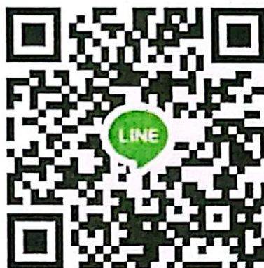
QR Code กลุ่มไลน์เพื่อส่งแบบสอบถามฯ