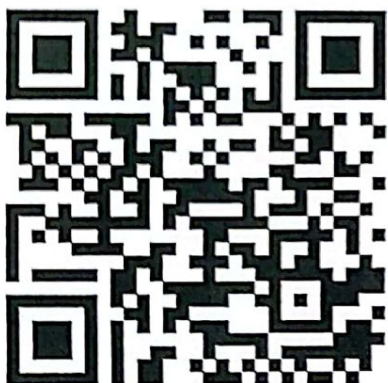
QR Code แบบสอบถามฯ