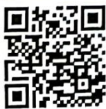
QR Code แบบสอบถามฯ

กองยุทธศาสตร์และงบประมาณ ฝ่ายนโยบายและแผนงาน