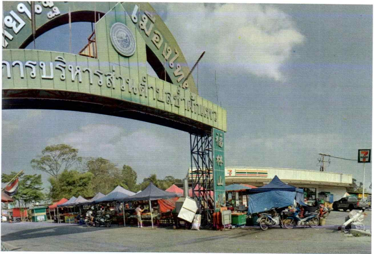
ตลาดตลาดเซเว่นสาขามชนชำผักแพว